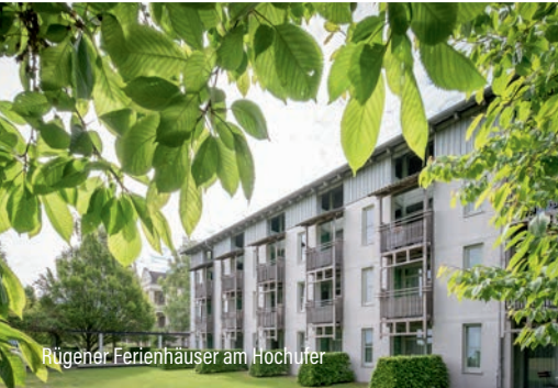
Rügener Ferienhäuser am Hochufer