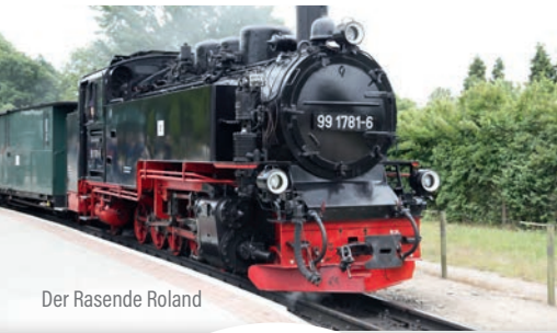
Der Rasende Roland